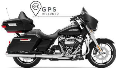
STREET GLIDE TOURING