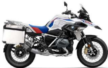
R 1250 GS